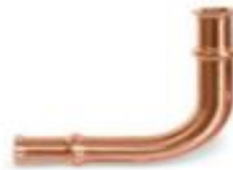
Zoomlock 5/16" Long Radius - 770601 Price: $13.10