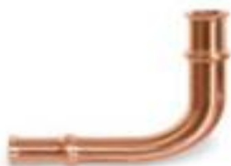
Zoomlock 7/8" Long Radius - 770606 Price: $24.31