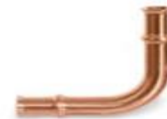
Zoomlock 3/4" Long Radius - 770605 Price: $23.38