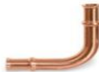
Zoomlock 5/8" Long Radius - 770604 Price: $19.64