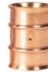
Zoomlock 3/4" Coupling - 770505 Price: $14.03