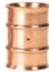
Zoomlock 5/8" Coupling - 770504 Price: $10.28