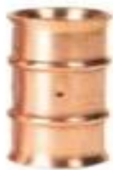
Zoomlock 7/8" Coupling - 770506 Price: $15.64