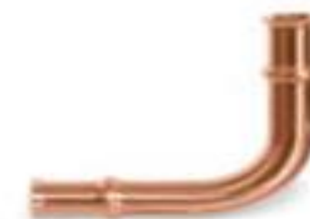
Zoomlock 1-3/8" Long Radius - 770608 Price: $39.28