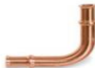
Zoomlock 1-1/8" Long Radius - 770607 Price: $29.92