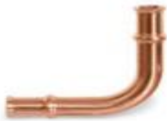
Zoomlock 1/4" Long Radius - 770600 Price: $11.22